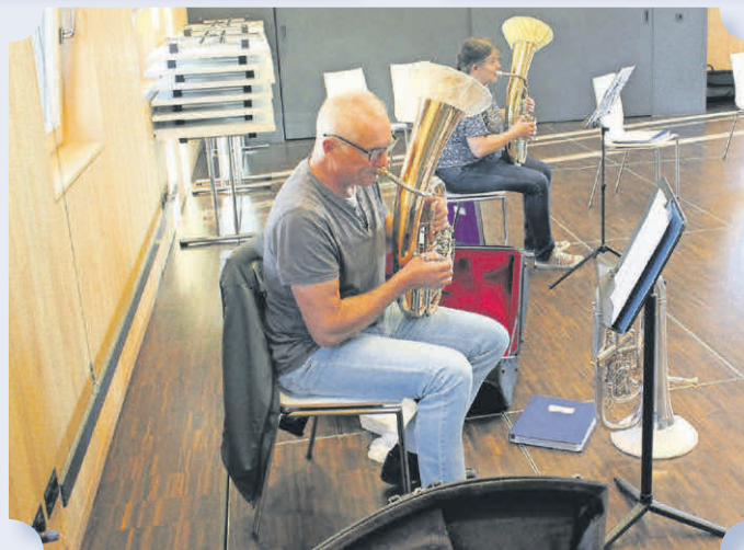
Blechblasinstrumente mit Mundschutz