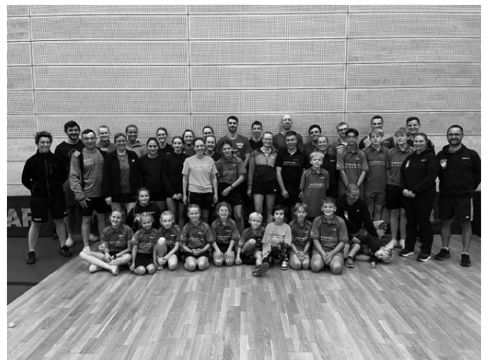
Teilnehmer des Trainingslagers mit Nationalspieler Patrick Franziska (hintere Reihe-Mitte).