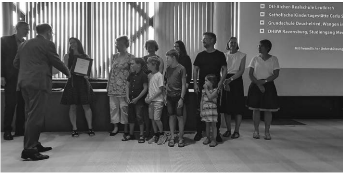
Verleihung des Bildungspreises in Ravensburg am 17.07.2023