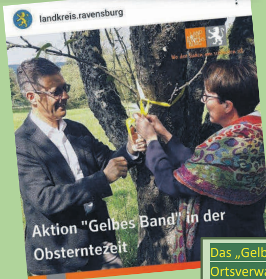
Aktion "Gelbes Band" in der Obsterntezeit

#landkreisravensburg #lebensmittel #gesundheit #gelbesband