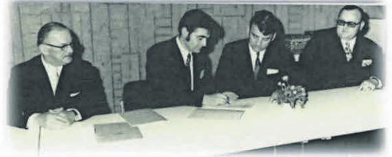
Eingliederung der Gemeinden Niederwangen, Schomburg und Deuchelried in die Stadt Wangen zum 01. Februar 1972

Am 17. Mai wurden in der Waldorfschule 50 Jahre Eingemeindung der Ortschaften in die Stadt Wangen im Zuge der Gemeindereform 1972 gefeiert. Umrahmt von einem Projektorchester, bestehend aus Musikerinnen und Musikern der Stadtkapelle sowie aller Blaskapellen der Ortschaften wurde das Jubiläum gefeiert. Es war ein sehr schöner und kurzweiliger Abend.