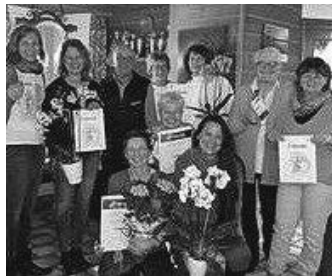
Geehrte Mitglieder für 10, 20 und 30 Vereinszugehörigkeit